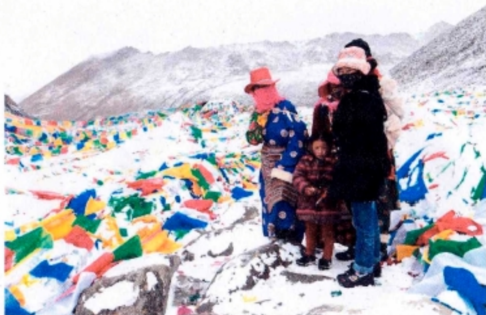
En montant au Drölma la (5660 m) Kailash, Tibet