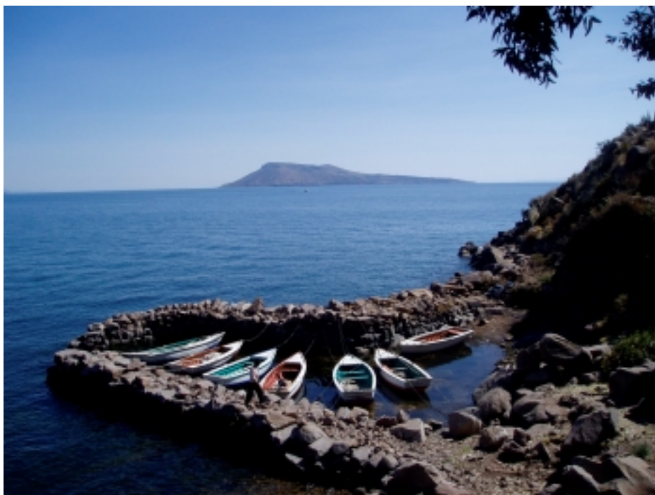
Ile de Taquile, lac Titicaca (3810 m), Pérou.