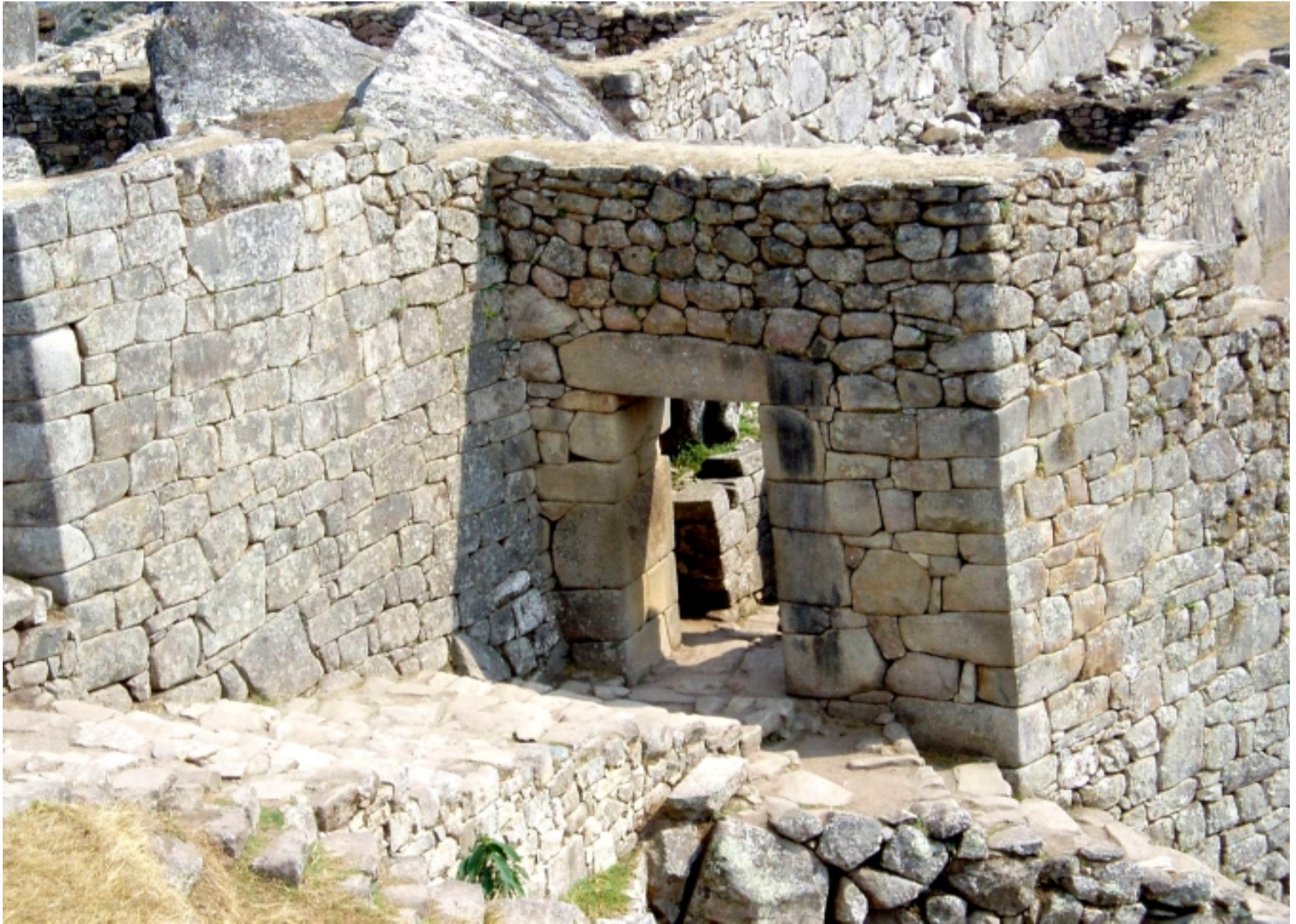
Daniel Arnaud-Vinard "En déclinant les Sefirot ... Sola fide !" 02/01/17 10:01 - Textes et illustrations déposés @ SGDL - Reproduction interdite sans accord de l'auteur.