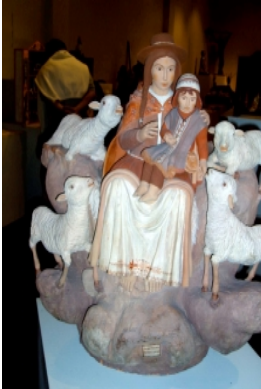
Art populaire au Musée de Cuzco, Pérou