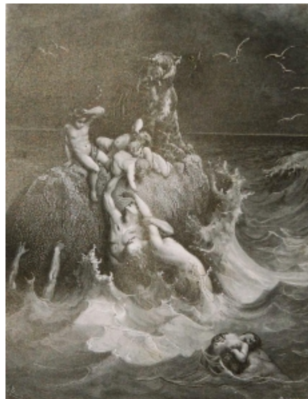
"Déluge" par Gustave Doré - Illustration dans la Bible remise à son pasteur, Eugène Arnaud, par l'église réformée de Crest en l'an 1900

(*) "Ton âme est dans le vrai si tu en vois le sens" (" Théétète ", dialogue de Socrate, Platon ) - (**) Fleuve du Nord de l'Inde (en sanskrit "Fils de Brahmâ") dont les crues dévastent périodiquement le Bangladesh.