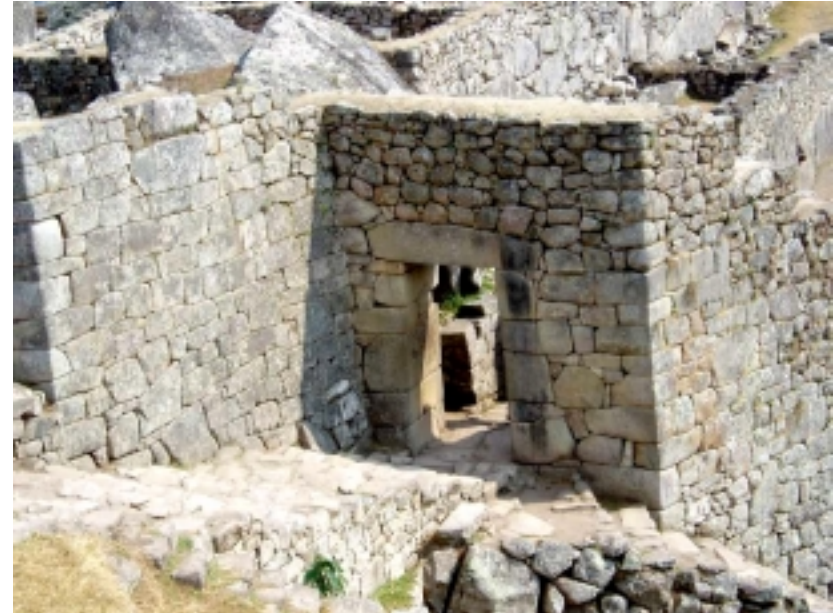
Une porte, Temple du Soleil, au Machu Picchu, Pérou