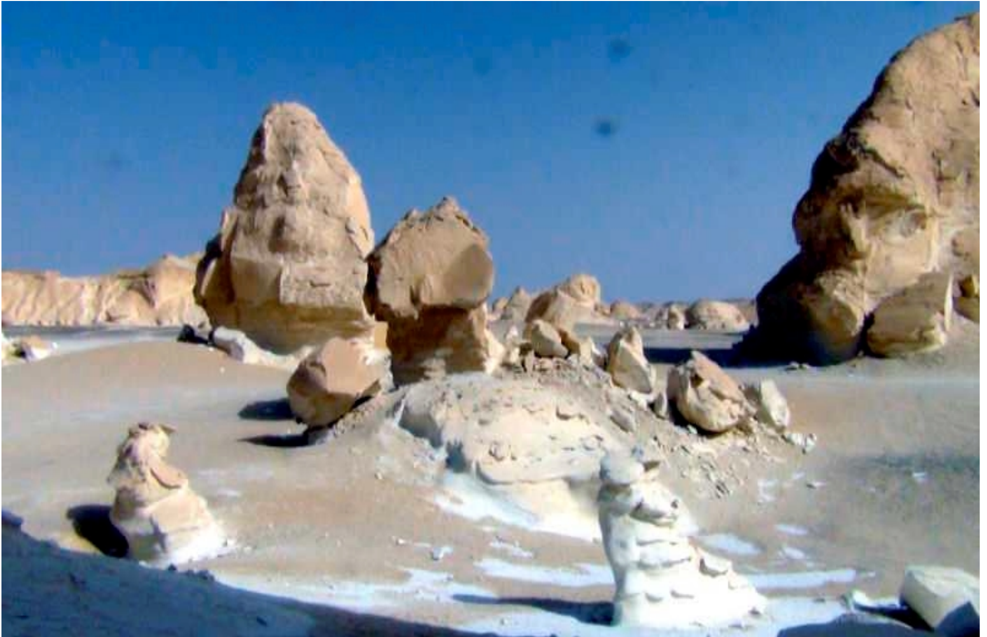
Daniel Arnaud-Vinard "En déclinant les Sejirot ... Sola fide !" 02/01/17 10:01 - Textes et illustrations déposés @ SGDL - Reproduction interdite sans accord de l'auteur.